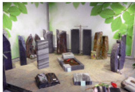
Shop im Shop-System: Im Eingangsbereich gab das Unternehmen den Besuchern einen Überblick über Neuheiten im Programm.