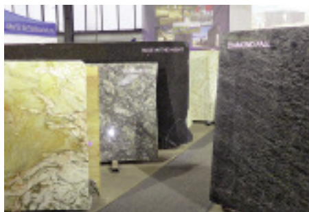
Die neuen Materialien waren auch in Form von Unmaßplatten zu sehen. Bestellt werden können sie bei der Destag-Schwesterfirma Just Naturstein.