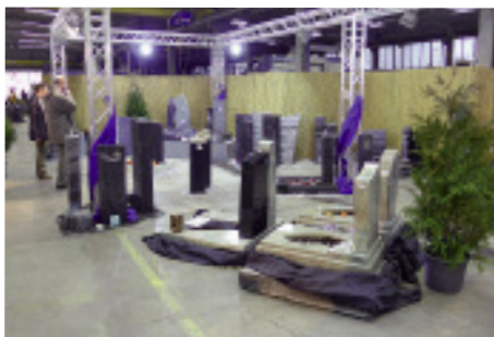
Highlight auf der Hausmesse: Grabmalmodelle aus den neuen Gesteinssorten Sky Grey, Verde Fantastico, Diamond Fall, Wonder Black und Persisch Beige